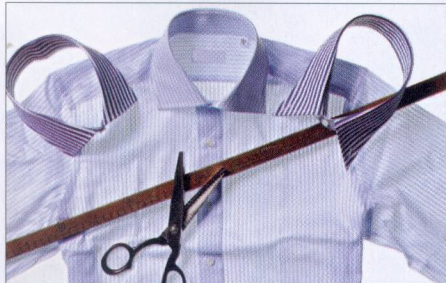
Piermarco Menini / DOVE

Indirizzo: piazza San Fermo 5, Albiate (MB), tel. 0362.93.18.37.